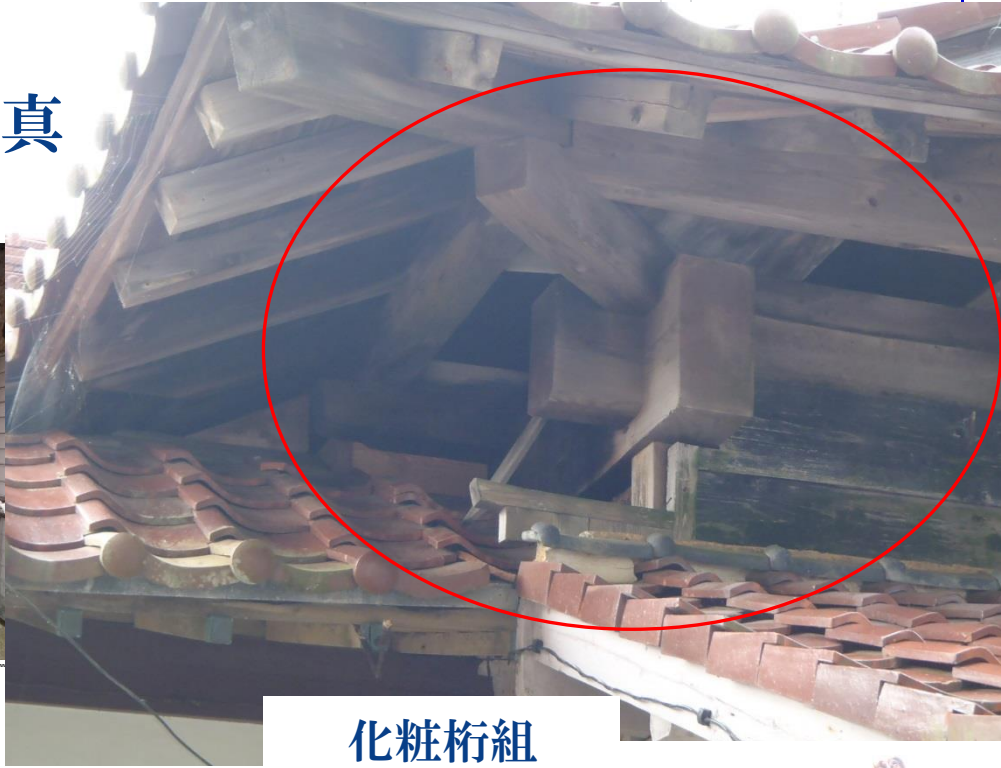
化粧桁組 軒板が外れ猫 が侵入