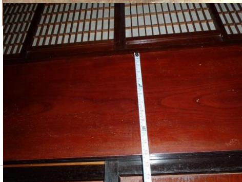
おかみ 化粧長押 H370