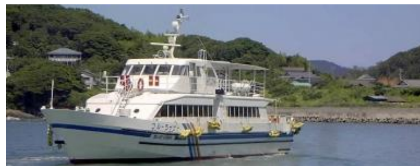
ブルーライナー(高速艇)