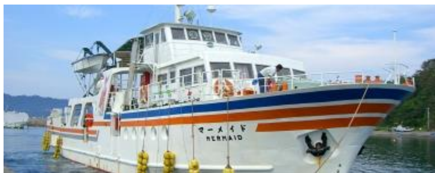
マーメイド(カーフェリー)