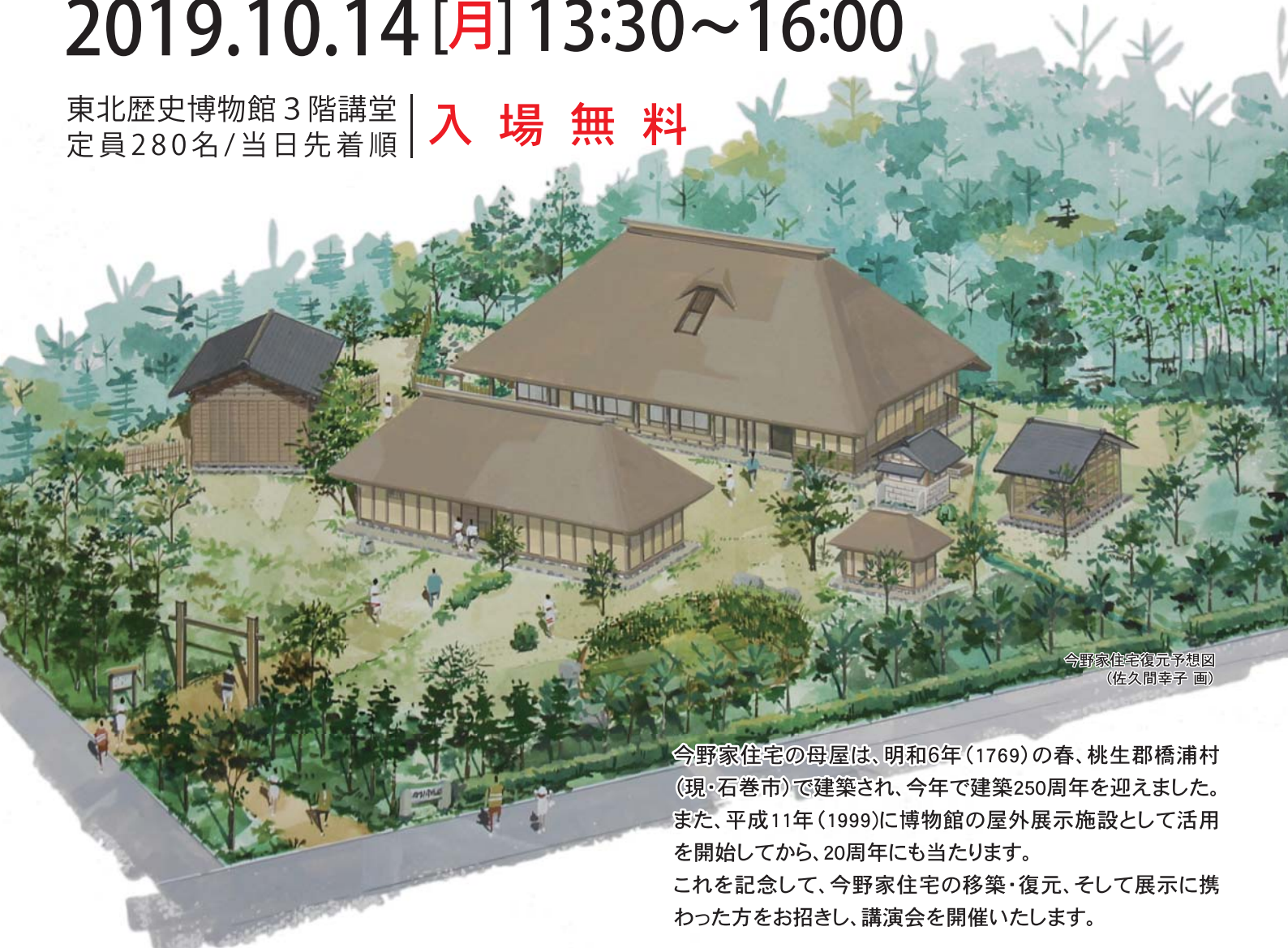
今野家住宅復元予想図 (佐久間幸子 画)

今野家住宅の母屋は、明和6年(1769)の春、桃生郡橋浦村(現・石巻市)で建築され、今年で建築250周年を迎えました。また、平成11年(1999)に博物館の屋外展示施設として活用を開始してから、20周年にも当たります。これを記念して、今野家住宅の移築・復元、そして展示に携わった方をお招きし、講演会を開催いたします。