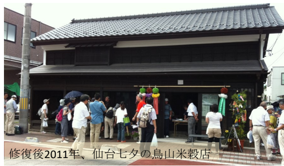
修復後2011年、仙台七夕の鳥山米穀店