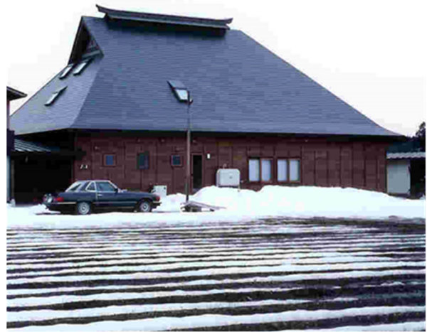
冬の千葉家住宅背面